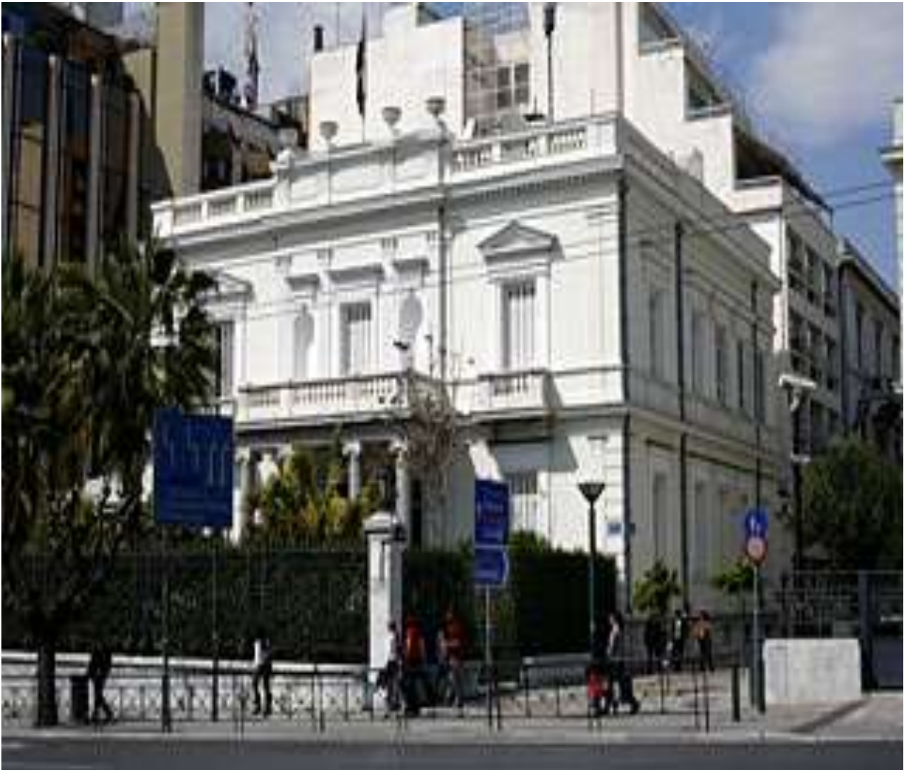
Αιγυπτιακή πρεσβεία ( Μέγαρο Νικολάου Ψύχα)