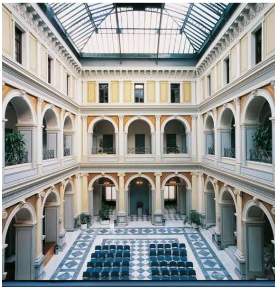
Μέγαρο Β. Μελά- εσωτερικό αίθριο