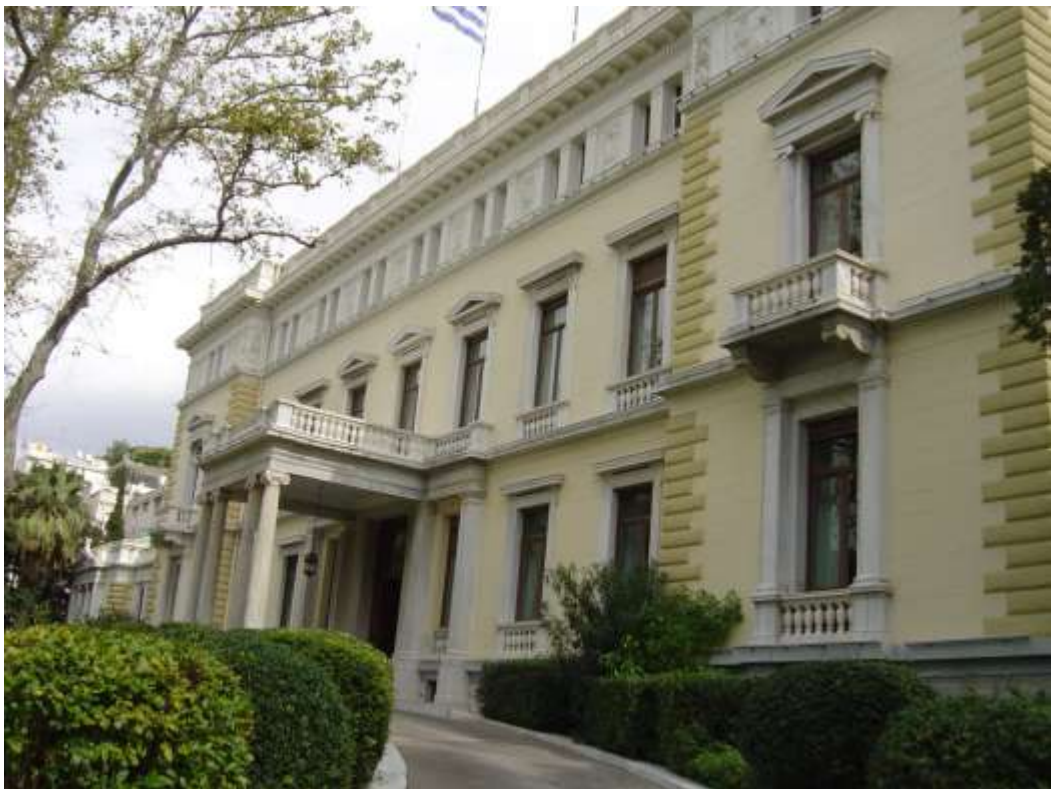
Προεδρικό Μέγαρο( Ανάκτορα Διαδόχου)