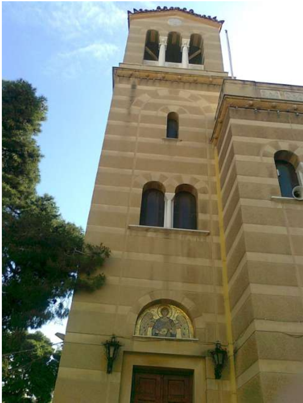
Άγιος Λουκάς Πατησίων