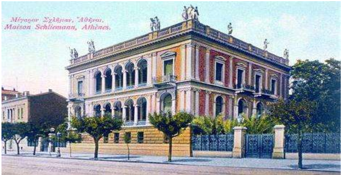
Νομισματικό μουσείο( Ιλίου Μέλαθρον – Μέγαρο Ε. Σλήμαν)