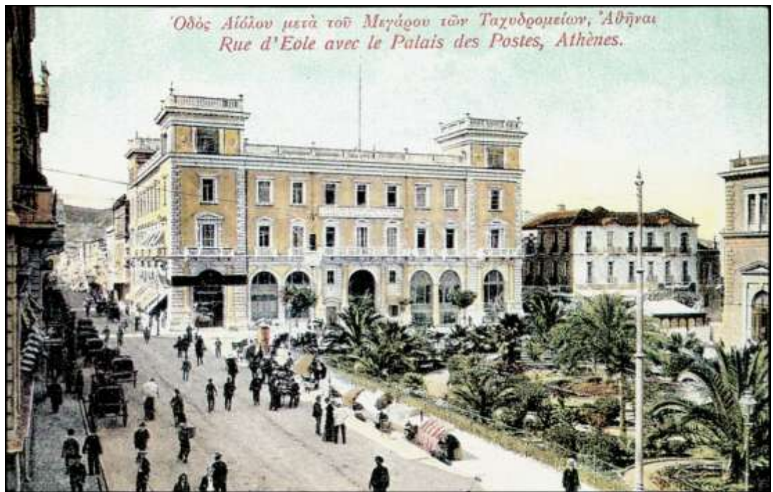
Μέγαρο Β. Μελά