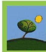
Φίλοι του Θεοτόκος

Το σωματείο «Φίλοι του Θεοτόκος» είναι ένα μη κερδοσκοπικό σωματείο που ιδρύθηκε το 1997, με αποκλειστικό σκοπό την ηθική και υλική ενίσχυση του μεγάλου κοινωνικού έργου του Ιδρύματος «Η ΘΕΟΤΟΚΟΣ».