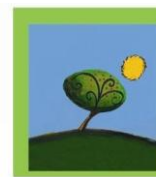
Φίλοι του Θεοτόκος

Το σωματείο εργάζεται διαρκώς για την εξεύρεση πόρων μέσω συνδρομών, δωρεών και εκδηλώσεων για να διασφαλίσει την εύρυθμη λειτουργία του Ιδρύματος. Το σωματείο «Φίλοι του Θεοτόκος» είναι μέλος της Ομοσπονδίας «ΜΑΖΙ ΓΙΑ ΤΟ ΠΑΙΔΙ».