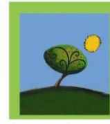
Φίλοι του Θεοτόκος

Το σωματείο εργάζεται διαρκώς για την εξεύρεση πόρων μέσω συνδρομών, δωρεών και εκδηλώσεων για να διασφαλίσει την εύρυθμη λειτουργία του Ιδρύματος. Το σωματείο «Φίλοι του Θεοτόκος» είναι μέλος της Ομοσπονδίας «ΜΑΖΙ ΓΙΑ ΤΟ ΠΑΙΔΙ».