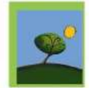
Φίλοι του Θεοτόκος

Κατά το Εκπαιδευτικό έτος 2007-2008, συνολικά 10 εκπαιδευόμενοι εντάχθηκαν σε Γενικά και Ειδικά σχολεία και Νηπιαγωγεία. Από αυτά ένα εντάχθηκε σε Γενικό Σχολείο, 6 σε Ειδικά Σχολεία και 3 σε Γενικά Νηπιαγωγεία. Συχνά οι γονείς δεν αποδέχονται πρόταση της Διεπιστημονικής Ομάδας προκειμένου να ενταχθεί σε Ειδικό σχολείο το παιδί τους και προτιμούν να παραμείνει στο «Θεοτόκος», κάτι που σημαίνει ότι ο ανωτέρω δείκτης ένταξης είναι χαμηλότερος από ότι θα έπρεπε.