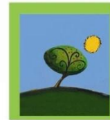
Φίλοι του Θεοτόκος

Το σωματείο « Φίλοι του Θεοτόκος » είναι ένα μη κερδοσκοπικό σωματείο που ιδρύθηκε το 1997, με αποκλειστικό σκοπό την ηθική και υλική ενίσχυση του μεγάλου κοινωνικού έργου του Ιδρύματος «Η ΘΕΟΤΟΚΟΣ».